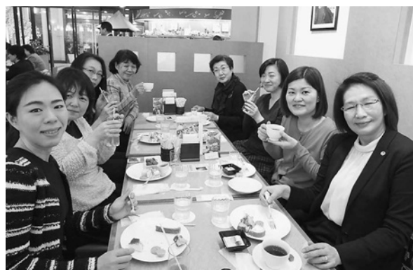
お茶会でリラックス