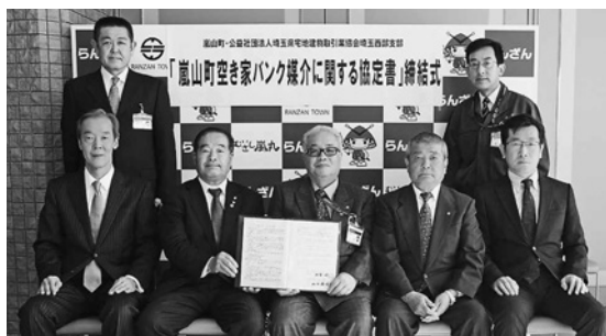
嵐山町の岩澤町長（中央）と弊会の山口埼玉西部支部長（前列左から2人目）

嵐山町では、空き家バンクへの物件登録者を募集して、利用希望者に物件を紹介します。一方、埼玉西部支部では、空き家バンクに賛同する会員業者を選定して、空き家の売却・賃貸に協力します。