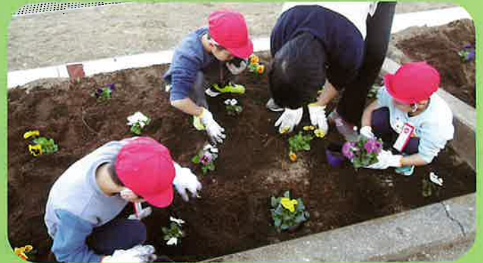
家庭募金緑化事業