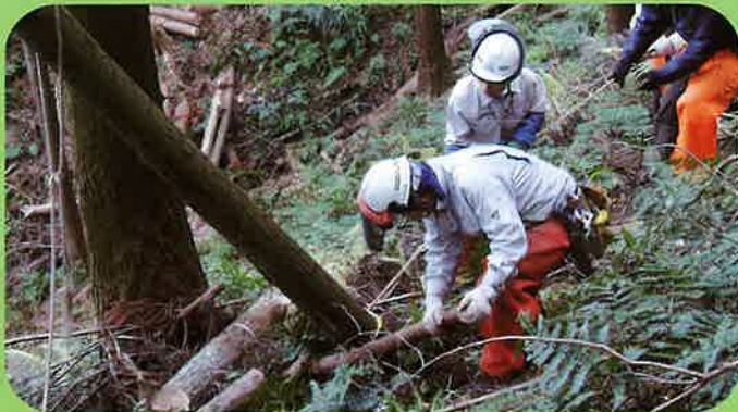
ボランティアによる整備