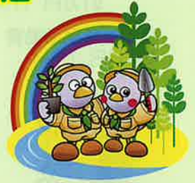
第75回全国植樹祭 シンボルマーク