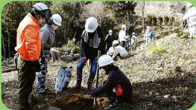
緑の少年団活動(植樹体験)