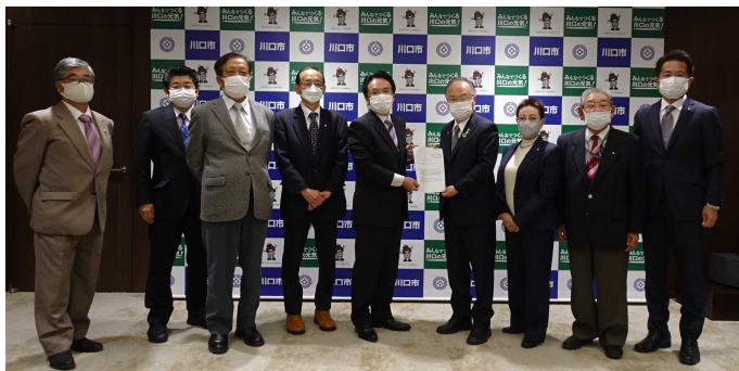
右から4番目：奥ノ木市長, 右端：若谷市議

11月10日(木) 蕨市 11月11日(金) 川口市 11月17日(木) 戸田市