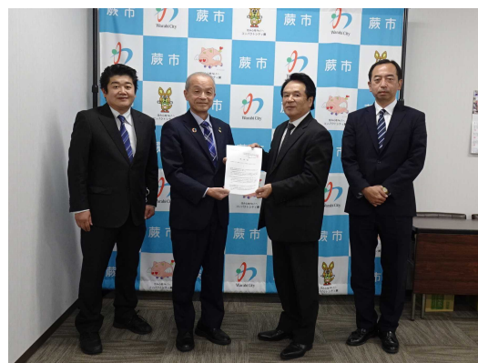
左から2番目：頼高市長

蕨駅周辺の再開発に関わる審議会等委員に、蕨市内の地域事情を熟知し、不動産取引等に精通している公益社団法人埼玉県宅地建物取引業協会会員の登用