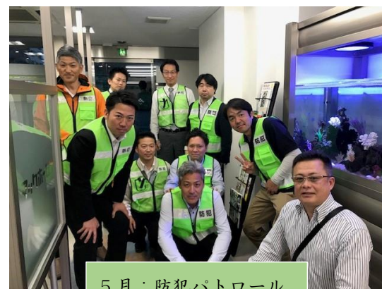
5月：防犯パトロール

多種多様なニーズが求められる現在、情報の共有化、業務の連携、が必要かと思われます。