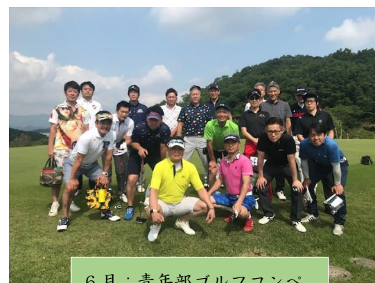
6月：青年部ゴルフコンペ