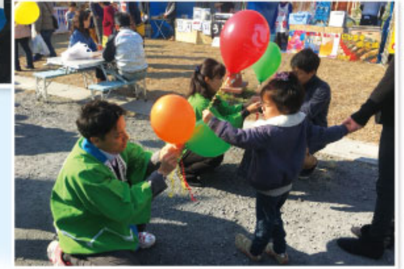
深谷市不動産フェア

会員向け/参加無料 ※「ハトマークサイト埼玉」をご利用の会員は、必ずご参加ください!!