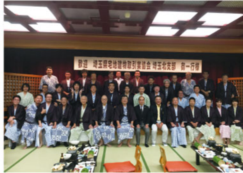
埼玉北支部 親睦旅行

委員会一同でご案内いたしますので、今後とも会員の皆様のご協力、ご参加をよろしくお願い致します。