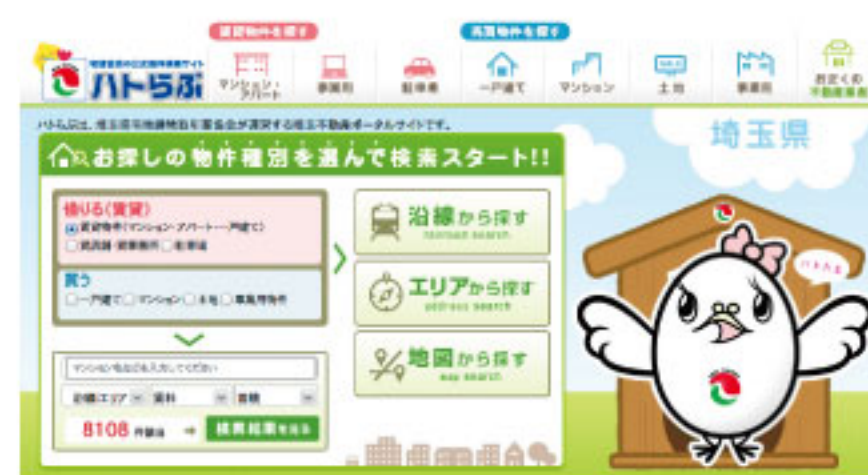
ホームページ画面

また、それに伴い、物件情報を登録するシステムも変更となり、業務支援機能が大幅に強化されます。Web営業に即役立つツールを多数実装するほか、宅建協会のスケールメリットを活かした業者間流通(BtoB)システムも備えた最新のクラウド型物件登録システムとなります。