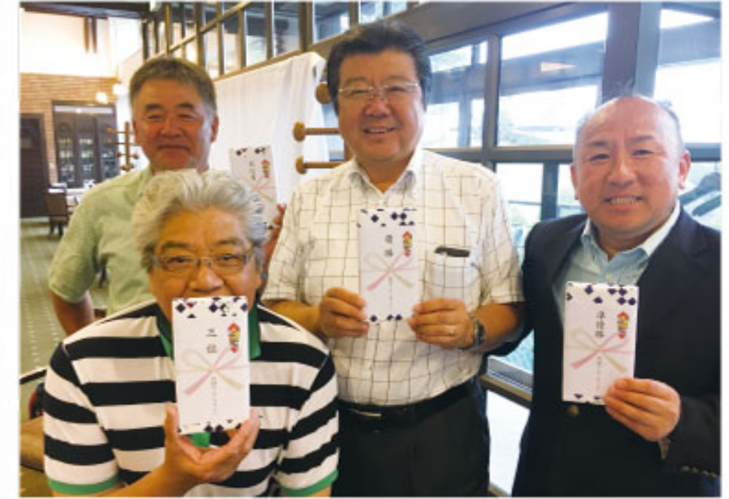
第16回埼玉北支部チャリティゴルフコンペ