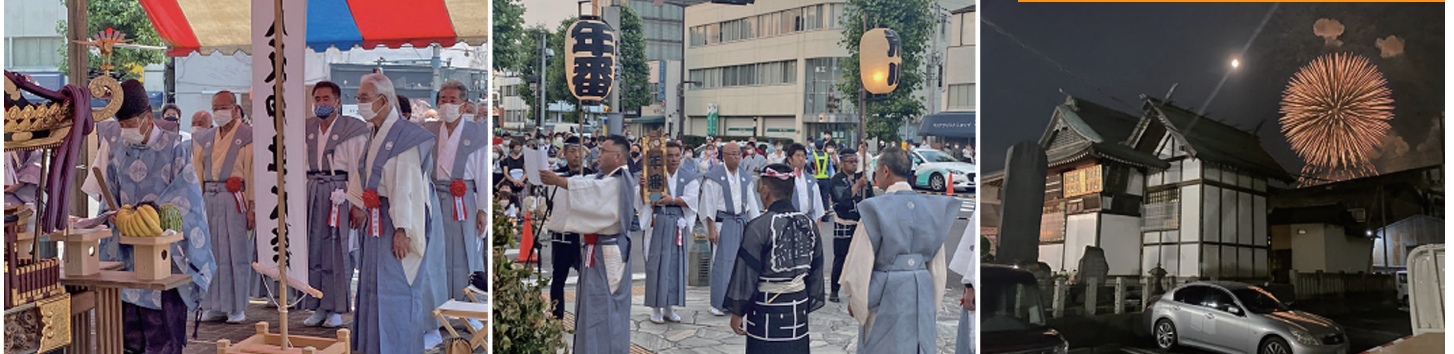
令和3年 協賛した「熊谷うちわ祭」