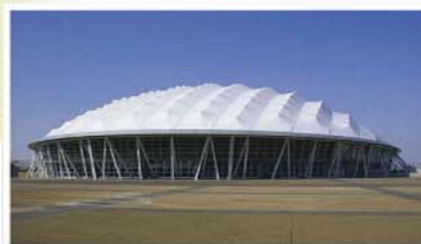
熊谷スポーツ文化公園