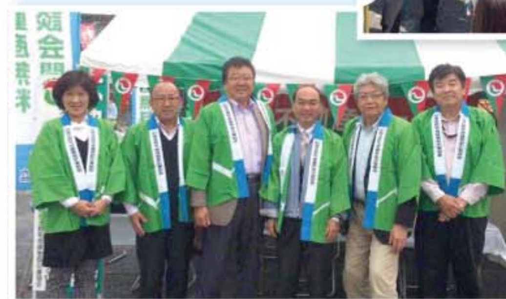
深谷市、中山道沿線商店街

深谷市では10月31日(土)、11月1日(日)、中山道沿線商店街にて、寄居町では11月14日(土)、寄居町総合体育館、アタゴ記念館前会場にて開催し、多くの方々に御来場頂きました。熊谷市では上記の通り開催いたしますので、是非お越しください。