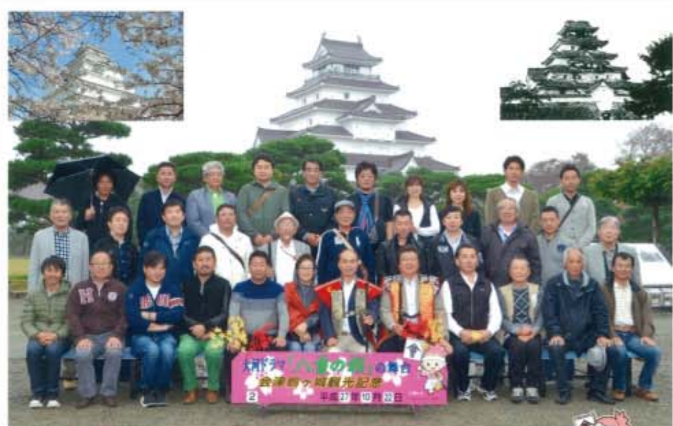
公益社団法人 埼玉県宅地建物取引業協会 埼玉北支部