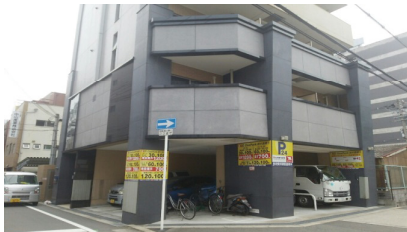
マンション駐車場の空き スペースを有効活用