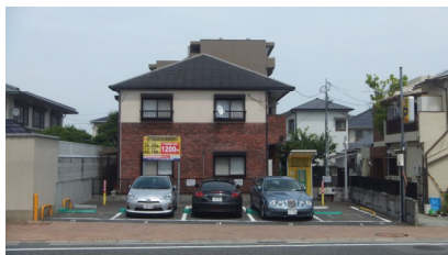
家の庭の一部をコイン パーキングとして有効活用