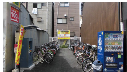
狭小地をコイン駐輪場 として有効活用