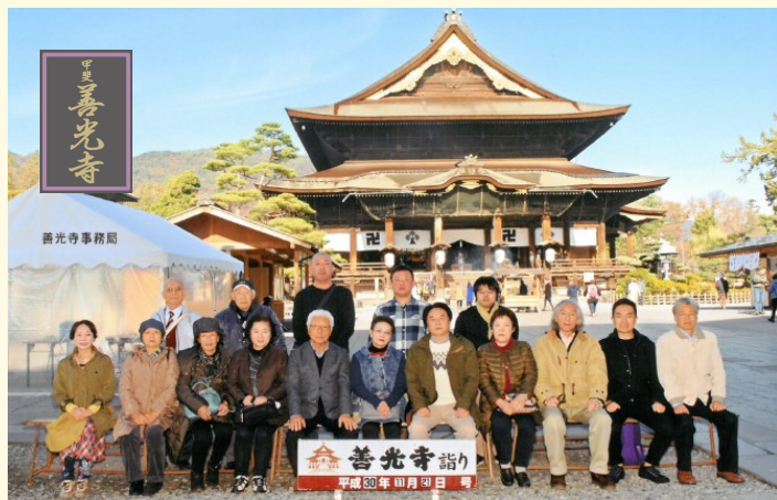
善光寺にて記念撮影

2日目には、大河ドラマ「真田丸」の舞台上田城と江戸時代の名力士「雷電為右衛門」のふるさと東御市の道の駅に行き歴史を満喫しました。