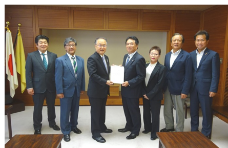
左から3番目: 奥ノ木信夫 川口市市長, 右: 若谷正巳 川口市議会議員

要望の回答は、届き次第お伝えいたします。引き続き活動を行いますので、行政への要望がございましたら事務局までご連絡ください。