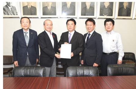
左から2番目: 頼高英雄 蕨市長, 右から2番目: 小林利規 蕨市議会議員