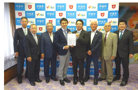
右から5番目: 菅原文仁 戸田市長