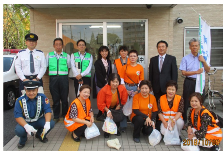
戸田駅西口交番にて