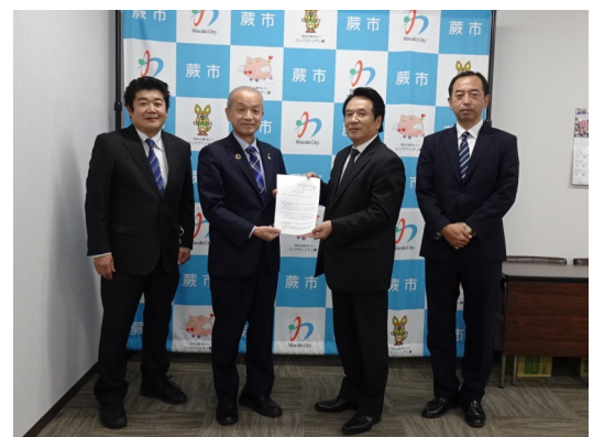
左から2番目：頼高市長

蕨駅周辺の再開発に関わる審議会等委員に、蕨市内の地域事情を熟知し、不動産取引等に精通している公益社団法人埼玉県宅地建物取引業協会会員の登用