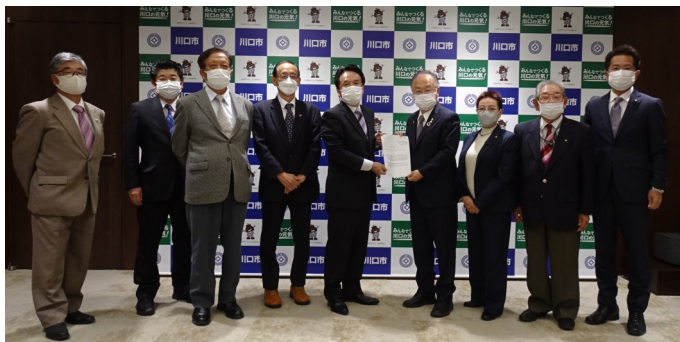
右から4番目：奥ノ木市長, 右端：若谷市議

11月10日(木) 蕨市 11月11日(金) 川口市 11月17日(木) 戸田市