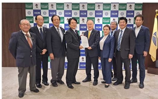
中央：奥ノ木市長、右端：若谷市議