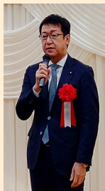
田中良生衆議院議員