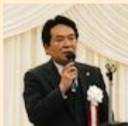
----- 来賓挨拶 -----