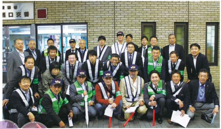
100回を迎えた防犯パトロール