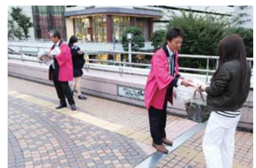
ひたたくり防止キャンペーン