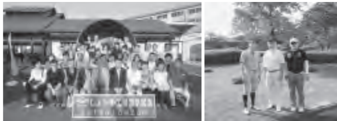
銚子 ヤマサしょうゆにて

新年明けましておめでとうございます。謹んで新春のお慶びを申し上げます。ふじみ野地区の地区長を拝命し一年が過ぎました。昨年4月新しい顔ぶれで開催した役員会で今後の事業計画が報告され地区事業がスタートいたしました。2市1町で開催された不動産フェアは何処も大盛況でした。子供たちに人気のある綿菓子の提供では長い行列が絶えず、製造する若手の役員は休む間もなく丸くて美味しそうな綿菓子を作りました。また、恒例の日帰りバス旅行では秋空のもと千葉・銚子方面へ行き、舟盛の新鮮な魚介類を食べ、しょう油工場の見学や銚子電鉄の電車にも乗りました。50名近くの会員にご参加いただき、和気藹々と過ごしました。本年の地区事業においても、行政機関との取組み、役立つ情報発信、会員間の親睦を深める事業等を実施してまいります。どうぞご支援ご協力のほど宜しくお願い申し上げます。結びにあたり、会員皆様のご健勝とご多幸を心よりご祈念申し上げます。