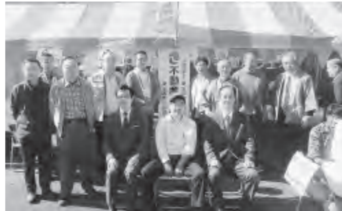
支部長・支部専務理事・情報提供委員長と一緒に