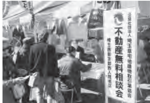
アンケート協力者に「はとたまボールペン」(記念品)を