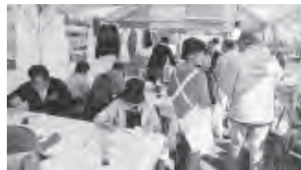
鶴ヶ島商工会・宅建部会協賛